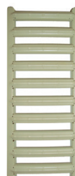
Grille passerelle en acier galvanisé couleur sable