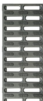
Grille passerelle Microgrip anti- dérapante en polypropylène