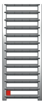
Grille passerelle en acier inoxydable