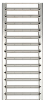
Grille passerelle en acier galvanisé