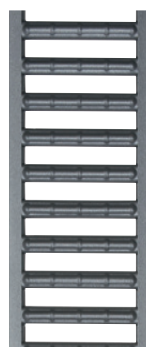
Grille passerelle en acier galvanisé couleur anthracite